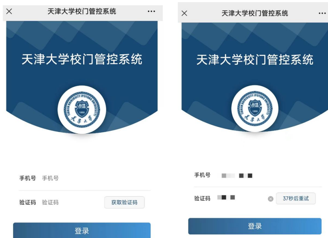
图 1 获取验证码登录

用户初次登录后需进行身份认证，请确保已在非固定编系统已添加过人员信息。用户输入手机号，获取验证码进行登录。