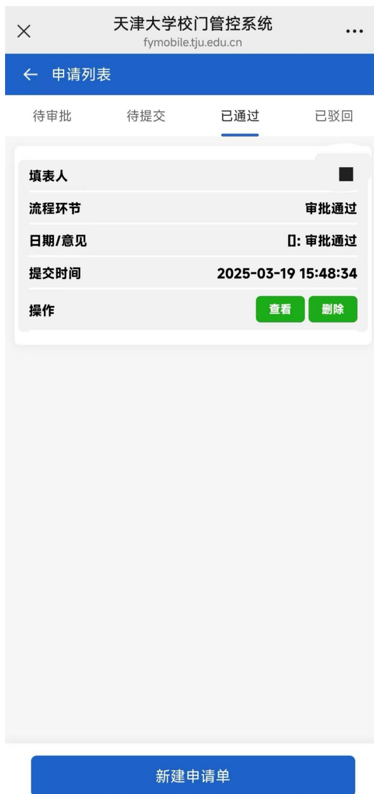
图 4 我的申请